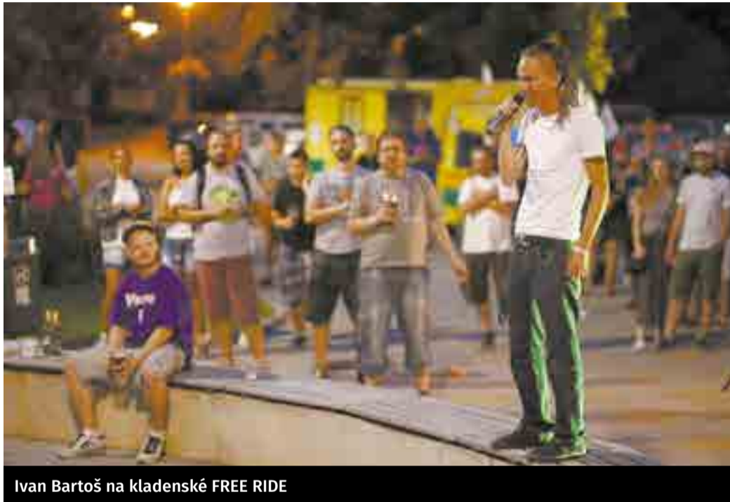
Ivan Bartoš na kladenské FREE RIDE

V kampani se opíráme o dobrovolníky, fanoušky, nápady a nadšení. Proto jsme vidět, přestože máme oproti největším stranám zhruba desetinový rozpočet. Přidat se můžete i vy, je to letos docela jízda. Hlavně ale 20. nebo 21. října přijďte k volbám a vezměte i přátele, kteří ještě váhají.