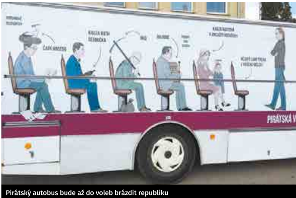
Pirátský autobus bude až do voleb brázdit republiku

Vstupné na veškeré akce je samozřejmě zdarma. Aktuální program akce naleznete na facebookových stránkách Pirátská Free Ride Tour 2017. Přijďte se pobavit.