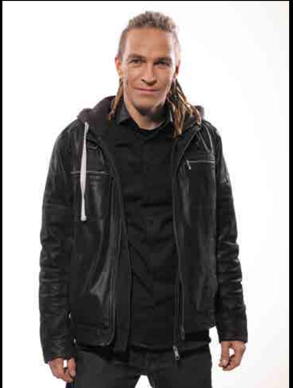
PhDr. Ivan Bartoš, Ph.D., předseda Pirátské strany, lídr Středočeského kraje

Hodně jsem cestoval, v USA i po Evropě, a myslím si, že naším vzorem by mohlo být Německo. To se s druhou světovou válkou vyrovnalo a společnost se úplně přenastavila. U nás to po válce kvůli komunismu bohužel nenastalo. Jde o řadu otázek, které liberální svět už neřeší a lidé se tam mají dobře. Není přitom žádný relevantní důvod, proč by to u nás nemohlo být taky tak. Pořád vidíme, jak nám roste HDP. Proč jsou tedy naše platy u čtyř pětín lidí nižší než minimální mzda v Německu? Není žádný důvod, proč být chudí. Veřejné zakázky např. nezohledňují kvalitu, podmínky pro zaměstnance, zodpovědnost firmy vůči svému okolí. Ani stát tedy reálně strukturou objednaných prací nepodporuje vyšší mzdy v komerčním sektoru. A navíc vidíme úniky, systémovou korupci na úrovni