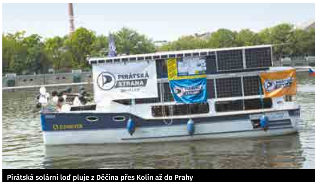
Pirátská solární loď pluje z Děčína přes Kolín až do Prahy

Ten sice pořádá vlastní Free Ride Tour po Středních Čechách, ale je i občasným členem posádky lodi. Již první víkend se zúčastnil návštěvy Ústí a Děčína v severních Čechách. Naši pirátskou loď budete moci spatřit, navštívit anebo se dokonce i svézt, a to až do konce září. Všichni jste srdečně zváni na palubu – společně na jedné lodi až do Parlamentu!