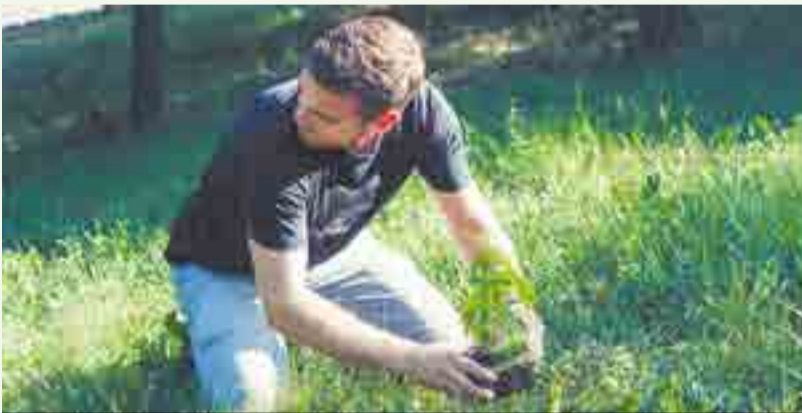
Legalizaci konopí věnujeme hodně úsilí a chceme ji zrealizovat správně.

konopí pěstované přes celé léto na prosluněné zahrádce (outdoor) dokážou dorůst i ke čtyřem metrům výšky a z každé může být získáno třeba půl kilogramu sušeného produktu. Vedle toho rostliny konopí pěstované pod umělým osvět-